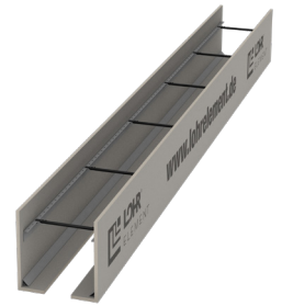
Typ RS F/F mit Ankerleiste