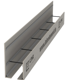
Typ RS F/F mit Ankerleiste mit Deckenrandabschalung