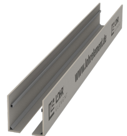
Typ RS F/F mit Trapezleiste