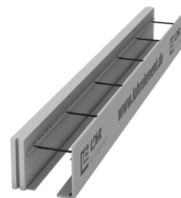
Typ RS 60/F NH mit Ankerleiste

Durch den Einsatz der verlegefertigen LohrElement Ringanker-, Ringbalkenschalungen spart der Bauprofi Zeit und somit Lohnkosten. Alle Randkosten einer konventionellen Schalung entfallen.