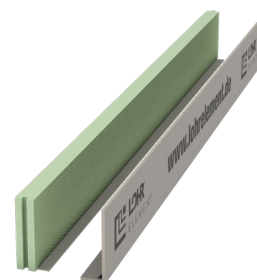
Typ RS 60/F ohne Ankerleiste