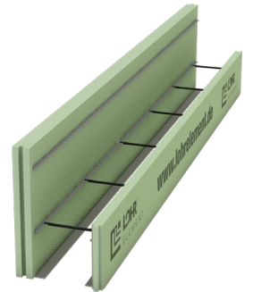
Typ RS 60/35 mit Ankerleiste mit Deckenrandschalung