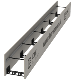
Typ MPA4 F/F mit Ankerleiste

Die optionale Ausführung aus „mineralisch geb. Flachpressplatte“ A2-s1, d0 ist für den Einsatz als Brandwand F90 geeignet (ab Mauerwerksdicke 15cm).