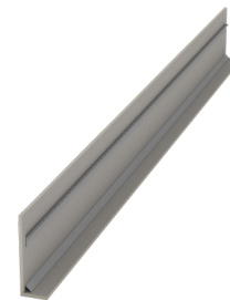
Typ FA mit Ankerleiste

Durch den Einsatz der verlegefertigen LohrElement Deckenrandschalungen spart der Bauprofi Zeit und somit Lohnkosten. Alle Randkosten einer konventionellen Schalung entfallen.