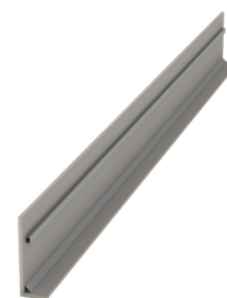
Typ FT mit Trapezleiste