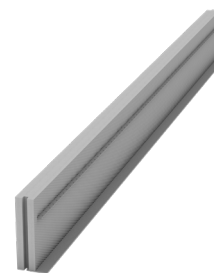
Typ DFE 60 NH mit Ankerleiste