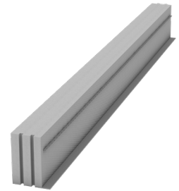
Typ DFE 140 NH mit Ankerleiste

Fußteil: 70 x 4 mm hochdruckfeste Faserzementplatte